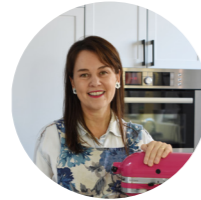
Clau Varleta @clauvarleta