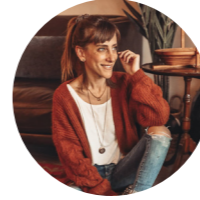
Min Rebolledo @minrebolledo