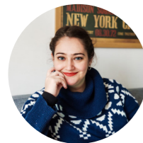
Fran Bastías @franbastias